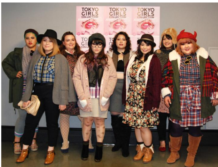
2014年9月開催【第19回 東京ガールズコレクション 2014 A/W】 「スマイルランド」初出展

「スマイルランド」は、ぽっちゃりさんが“着られる服”を提供するのではなく、“着たい服”を提供しております。《もっとトレンドの洋服が着たいけど、自分のサイズに合うオシャレな洋服がない》といったぽっちゃり女性のお悩みを解消するブランドとして、数多くのお客様にご支持を得てまいりました。