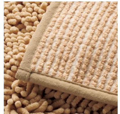
パイルと基布、ダブルで抗菌