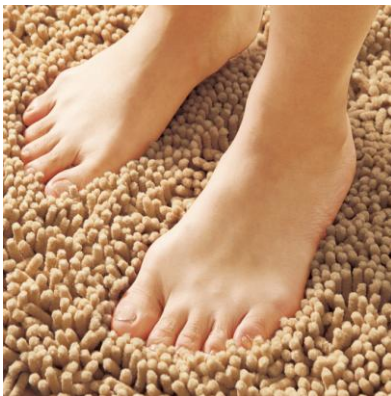
麻入りで足ざわりさらっと

乾きやすいポリエステル繊維と、吸水・通気性に優れた天然素材である麻（約 20%）を混紡し、モール状に撚ったパイル。モール構造で水分を素早く拡散し、さらっと感が長続きます。