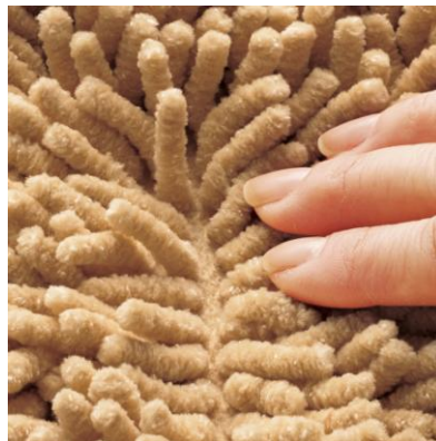
マットまるごとで吸水・速乾