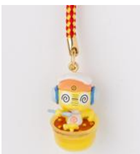
ケロロ桶ストラップ クルル曹長 本体価格 ¥580(+税)