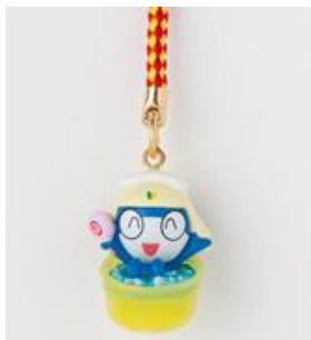
ケロロ桶ストラップ タママ二等兵 本体価格 ¥580(+税)