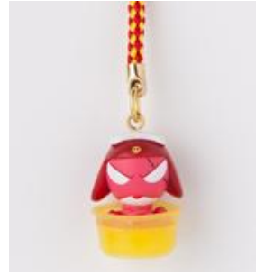
ケロロ桶ストラップ ギロロ伍長 本体価格 ¥580(+税)