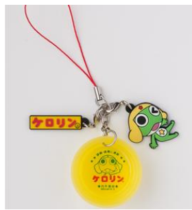
ケロロ桶ストラップ ラバーマスコット付き 本体価格 ¥700(+税)