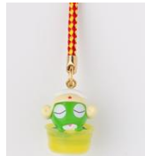
ケロロ桶ストラップ ケロロ軍曹 本体価格 ¥580(+税)